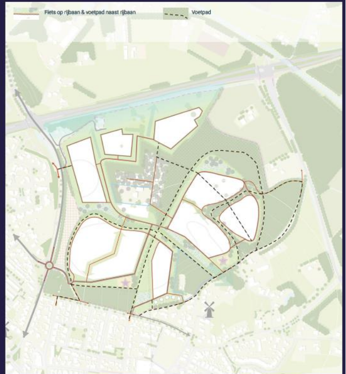
Voetganger & fiets