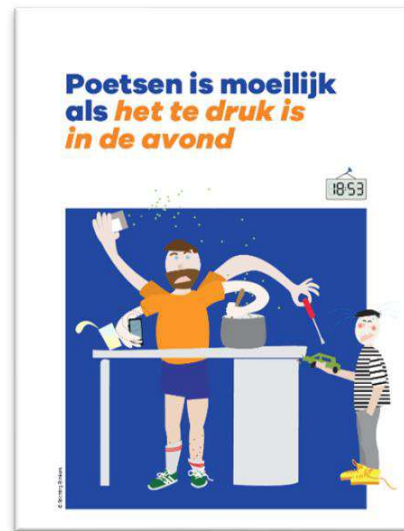
Figuur 1. Gesprekskaarten: barrières identificeren aan de hand van de Uitblinkers methodiek.

Het Evaluatiebureau is gevraagd om een procesevaluatie om tussentijds inzicht te geven in het bereik, de waardering en de uitvoering van de pilot 'Elke peuter- en kleutermond gezond!'.