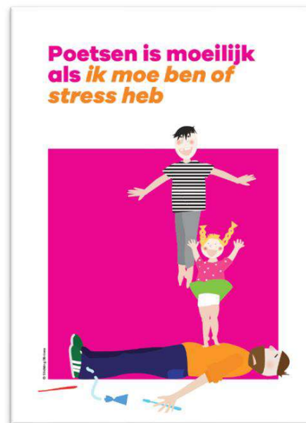
Figuur 5. Gesprekskaarten: barrières identificeren aan de hand van de Uitblinkers methodiek.

betrokken professionals tevreden zijn over de pilot. Met de aanwezigheid van de mondhygiënist op het consultatiebureau krijgt primaire preventie rondom mondzorg vorm en is het bereik van ouders en kinderen groot. De meerwaarde wordt gezien in het feit dat de mondhygiënist in een minder klinische setting op een laagdrempelige manier ouders en kinderen kan informeren en adviseren. Er is voldoende tijd voor 'hands-on' poetsinstructies en uitleg rondom duimen, speengebruik en voeding. De Uitblinkers methodiek kan hierbij goed worden uitgevoerd. Aanbevelingen voor het vervolg van deze pilot betreffen het verkennen van de mogelijkheden om tot een goede planning van kinderen te komen, zodat mondhygiënist hun consulten goed gevuld kunnen krijgen. Verder kan aandacht worden besteed aan een optimale ruimte en daar waar er onvoldoende licht is, te werken met aanvullende materialen waardoor de gebitssituatie goed kan worden beoordeeld. Verder zou het declareren van kosten voor een consult van kinderen van een AZC geen belemmering moeten zijn doordat hier met de verzekeraar en/of de gemeente goede afstemming over is. Deze resultaten van deze evaluatie geven een positieve tussentijdse indruk van de pilot 'Elke peuter- en kleutermond gezond'. Professionals zijn enthousiast over het vervolg en zien uit naar mogelijke uitbreiding naar andere consultatiebureaus.