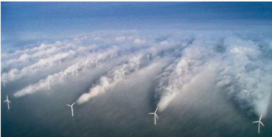
Wolken kunnen achter windturbines ontstaan zoals in de Horns Rev windpark in Denemarken.

11. Er kan sprake zijn van beïnvloeding van het weer: door turbulentie van achter elkaar draaiende turbines worden hogere en lagere luchtlagen gemengd, waardoor op grondniveau meer wind, warmte en wolken kunnen ontstaan.