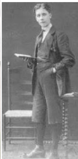
Hendrik Marsman 1899-1940