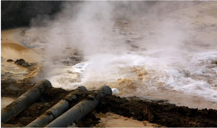
Waterverontreiniging in Baotou.

8. Ruim 90% van alle neodymium magneten komen nu uit China. De kans dat China een grondstoffen-importboycot instelt tegen Europa wordt geschat op meer dan 50% in de komende tien jaar. Daarmee is er geen zekerheid voor de nieuwbouw en vervanging van windmolens.