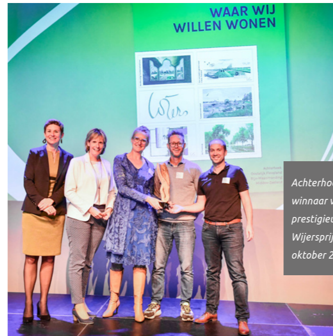
Achterhoek landelijk winnaar van de prestigieuze Eo Wijersprijsvraag, oktober 2023