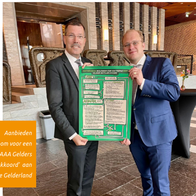
Aanbieden beslissing voor een triple AAA Gelders bestuursakkoord' aan provincie Gelderland