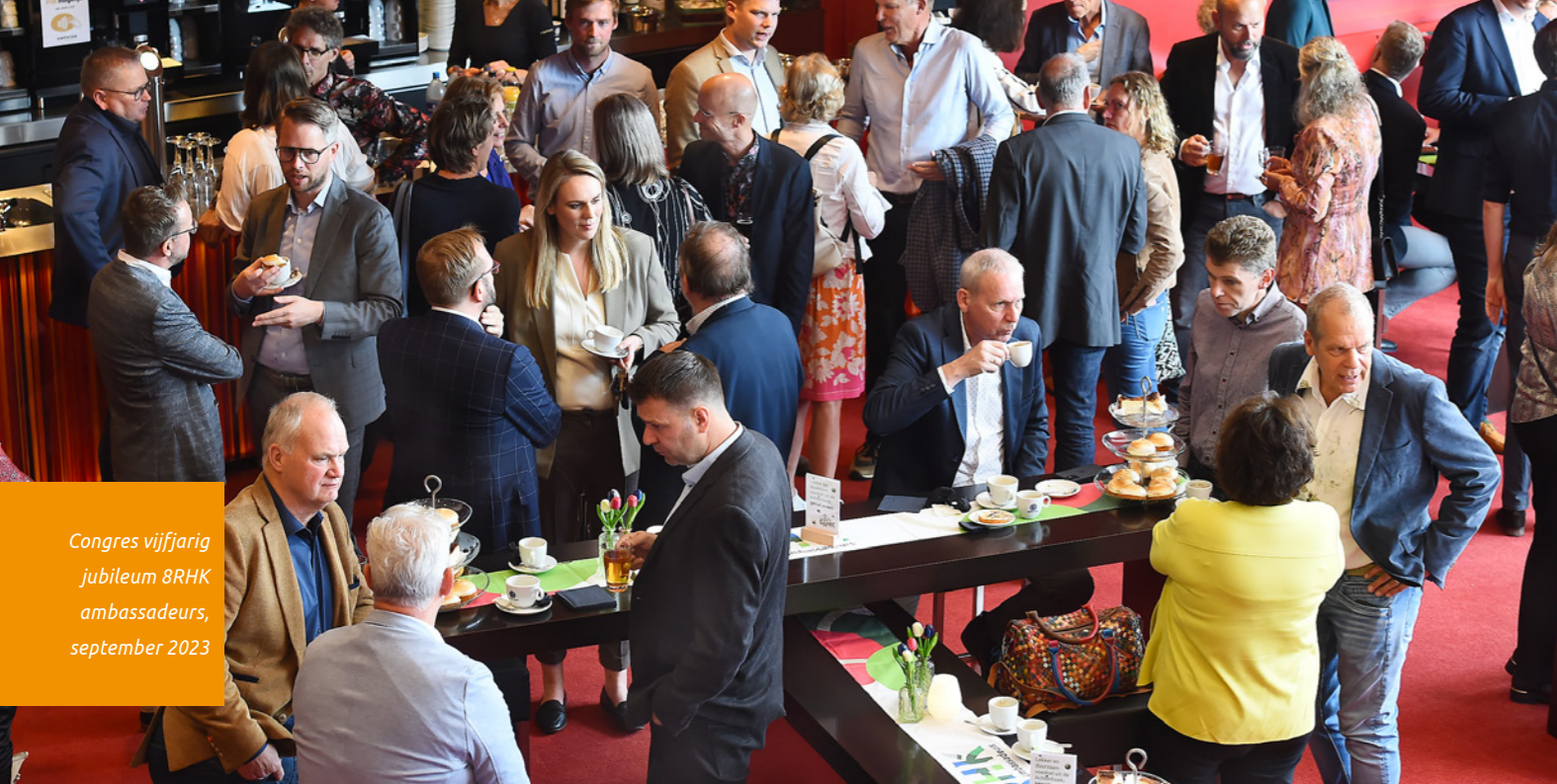
Congres vijfjarig jubileum BRHK ambassadeurs, september 2023