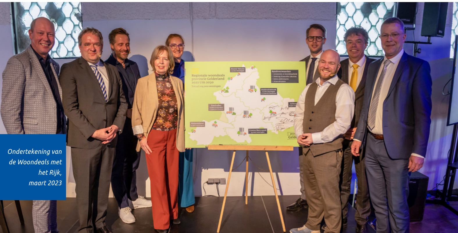
Ondertekening van de Woondeals met het Rijk, maart 2023

van de Achterhoek Monitor. Deze is doorontwikkeld zodat we nog meer en adequatere informatie voorhanden hebben over de woningopgave en de vorderingen van de in de Woonagenda opgenomen doelstellingen.