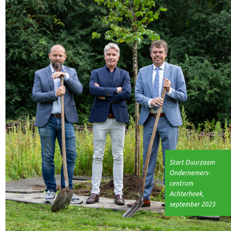
Start Duurzaam Ondernemers- centrum Achterhoek, september 2023

In 2024 wordt een plan voor regionale samenwerking voor herstel en versterken van de biodiversiteit uitgewerkt. Naast een aantal gemeenten zijn Waterschap Rijn en IJssel, Vereniging Agrarisch Landschapsbeheer Achterhoek, Natuurmonumenten