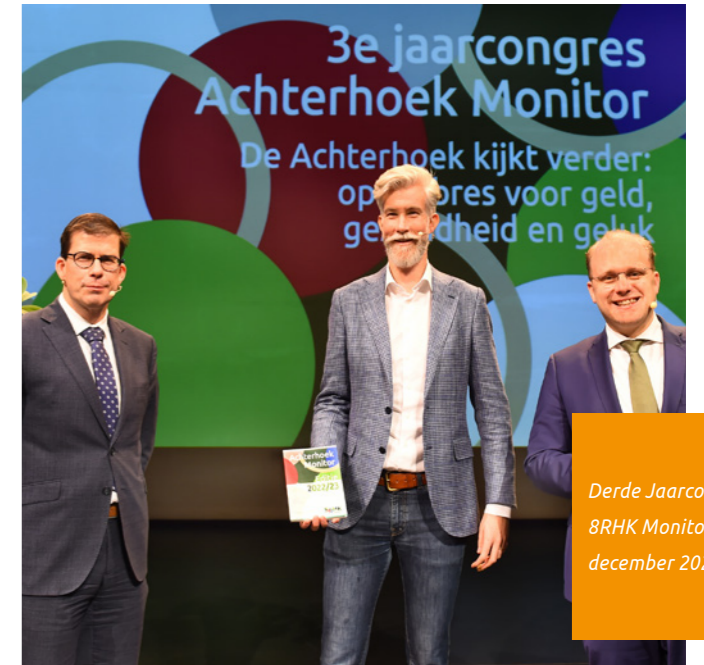
Derde Jaarcongres BRHK Monitor, december 2022