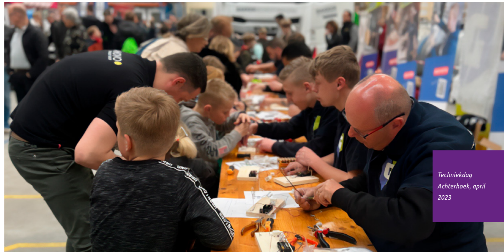
Techniekdag Achterhoek, april 2023

Er is een inventarisatie gemaakt van de lopende initiatieven in de regio op het vlak van werven, binden en ontwikkelen. Er is een veelheid aan projecten zowel vanuit de thematafel als daarbuiten. Voor ontwikkelen en werven gebeurt al veel, op het vlak van binden bijna niets. Het zwaartepunt voor de vervolgstappen ligt bij tien dragende projecten. Komende periode werken we aan een plan van aanpak om deze projecten beter te verbinden.