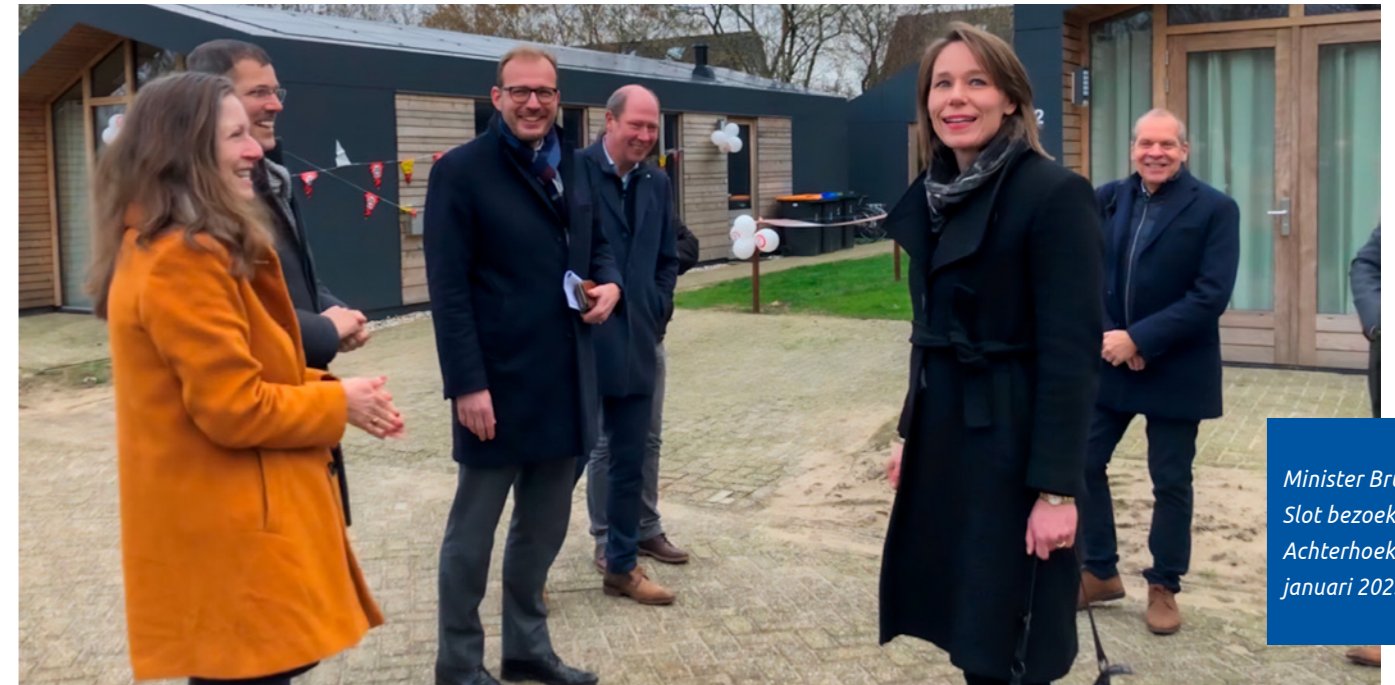
Minister Bruins-Slot bezoekt de Achterhoek, januari 2023

We meten onze voortgang en de ontwikkelingen in de woningmarkt via de Woon- en Vastgoedmonitor als onderdeel