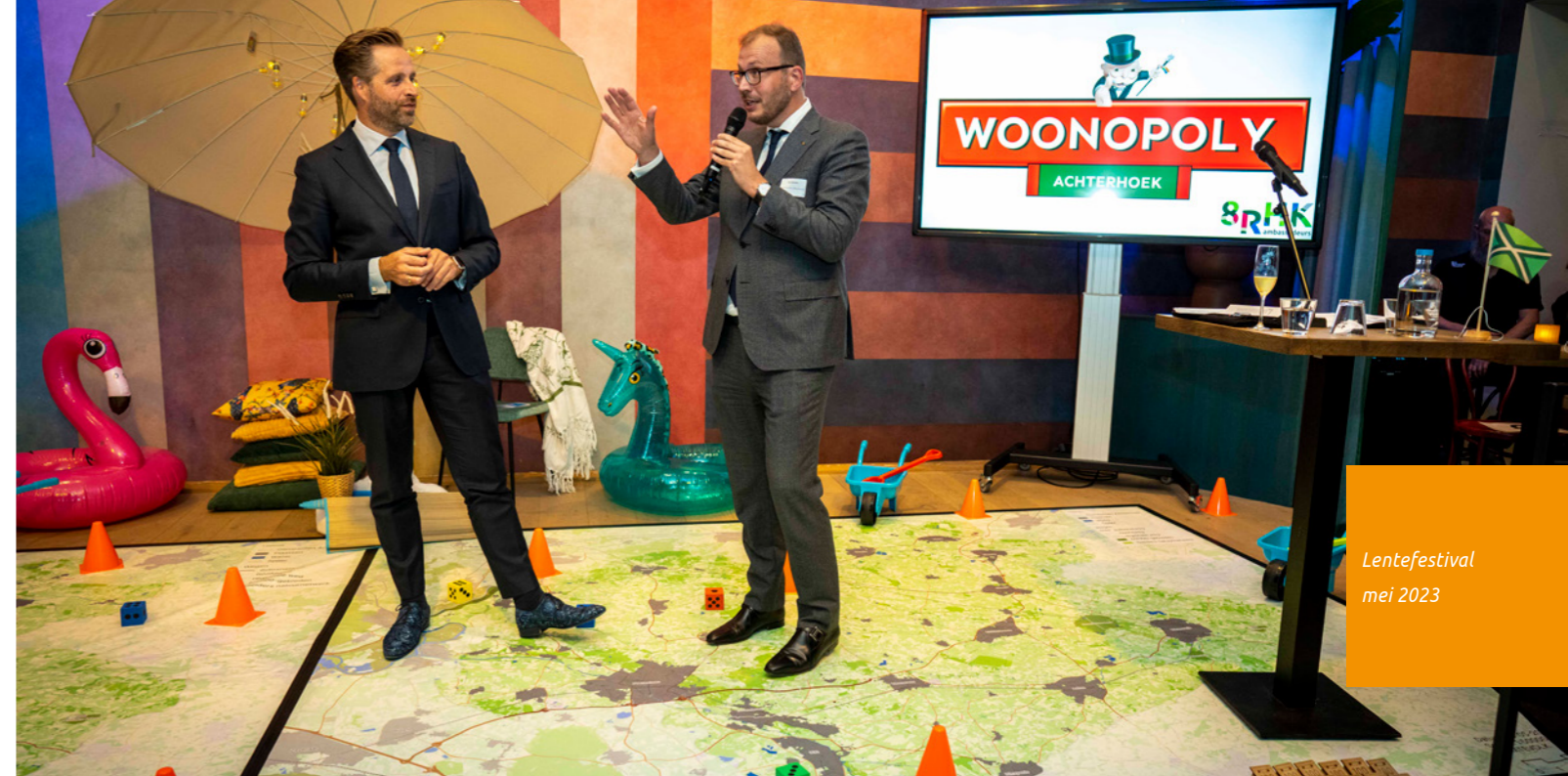
Lentefestival mei 2023