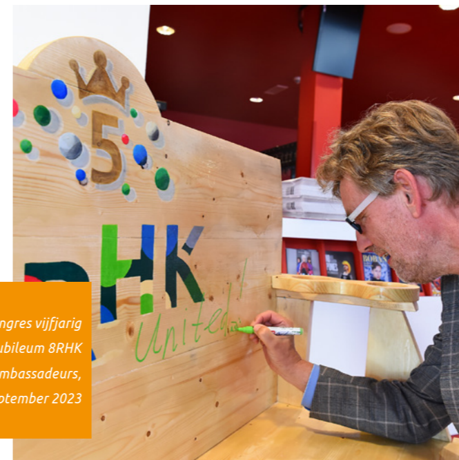
Congres vijfjarig jubileum BRHK ambassadeurs, september 2023