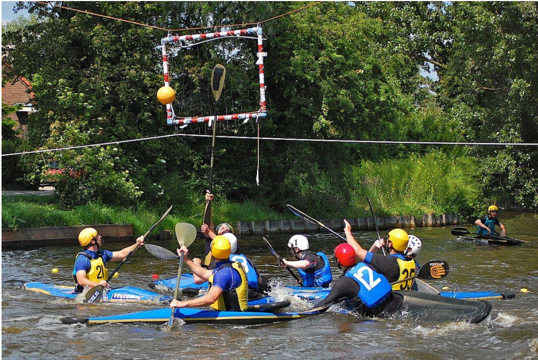
Foto3: een foto van het spelletje kanopolo

stroomt bovendien. Het is daarom voor ons niet mogelijk om toernooien bij de vereniging te houden, wat jammer is want ook dat trekt weer bezoekers naar Ulft toe. Wij zouden met de gemeente graag willen kijken of het mogelijk is om een officieel kanopoloveld aan te leggen, zodat we wel wedstrijden en toernooien kunnen organiseren in Ulft. Wat ons betreft zou dit kunnen in de inham die tegenover onze loods ligt, of voor het terras van het Schaftlokaal bij de DRU Cultuurfabriek. In beide gevallen gaat het voornamelijk om het uitdiepen van het water. Evenals een wildwaterbaan draagt een kanopoloveld bij aan de levendigheid op het water en daarmee aan het toerisme in de gemeente. Dat is een meerwaarde voor de sporters, toeschouwers, maar ook voor de ondernemers en draagt bij aan de sportieve reuring die de gemeente nastreeft.