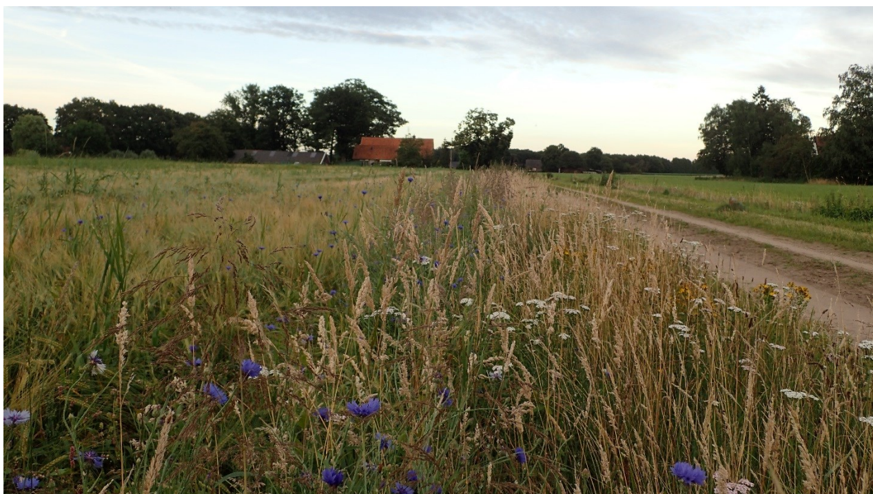
Afbeelding 1: Sfeerbeeld soortenrijke berm langs zandpad.

Daarnaast sorteert de gemeente voor op toekomstige ontwikkelingen zoals klimaatadaptatie; hoe gaan we om met extremen van het klimaat. Hoe reduceren we hittestress; hoe zorgen we ervoor dat we water vasthouden en dat er voldoende verkoeling is. Biodiversiteit is een actueel aandachtspunt (mede door de aandacht in de landelijke media) over de funeste achteruitgang van insecten in Nederland. Hoe zorgen we ervoor zorgen dat er voor flora en fauna voldoende geschikt leefgebied aanwezig is binnen de gemeente, waar kunnen we het landschap hiervoor versterken. Denk hierbij aan ecologisch bermbeheer in samenwerking met Provincie en het Waterschap waardoor er bloemrijke linten in ons landschap komen te liggen. Keuze van soorten bij aanleg nieuw groen en landschapselementen waar bijvoorbeeld insecten van kunnen profiteren.