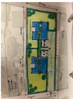
Situatieschets_Hesselweg 2-2a.jpeg 101K