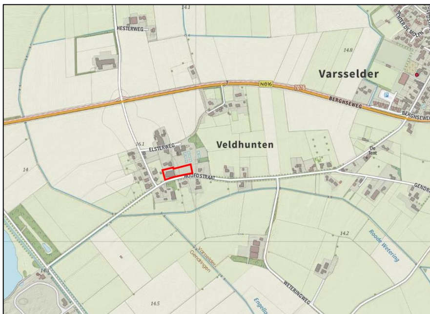
Figuur 1 Globale begrenzing onderzoeksgebied woningbouw Geurinkstraat (in rood)

In deze quick scan agrarisch geur wordt geïnventariseerd welke veehouderijen in de omgeving van het plangebied liggen, en waar mogelijke belemmeringen liggen. Tevens wordt onderzocht of ter plaatse van de planontwikkeling op voorhand een acceptabel woon- en leefklimaat kan worden gegarandeerd als gevolg van de voorgrond- en achtergrondbelasting. Indien dit niet op voorhand uit te sluiten is, worden er mogelijk vervolgonderzoeken aanbevolen waarbij een berekening van de voor- en achtergrondbelasting plaatsvindt. In figuur 1 is de locatie weergegeven.