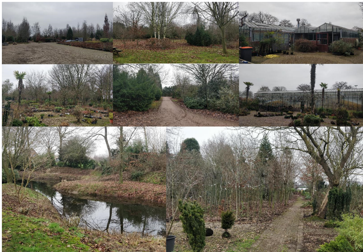
Impressie huidige situatie