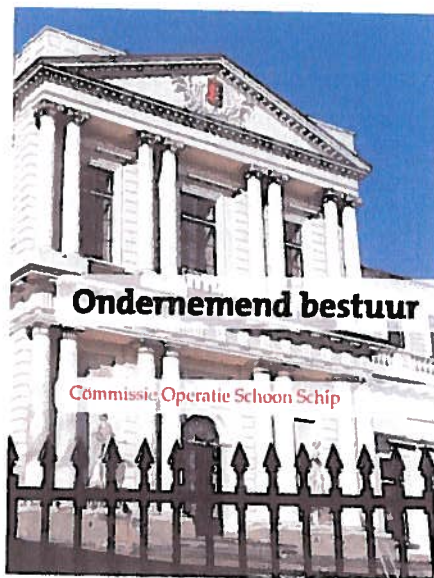
Operatie Schoon Schip in Noord-Holland.

De gemeente Maastricht voerde het instrument integriteitadvies in 2008 preventief uit om naast haar wethouders, ook haar individuele raadsleden te adviseren op gebieden waar zij mogelijk kwetsbaar waren. De raadsleden verstrekten op vrijwillige basis informatie aan adviseurs van BING die, op basis van deze informatie en de informatie verkregen uit open bronnen, een advies gaf aan het individuele raadslid