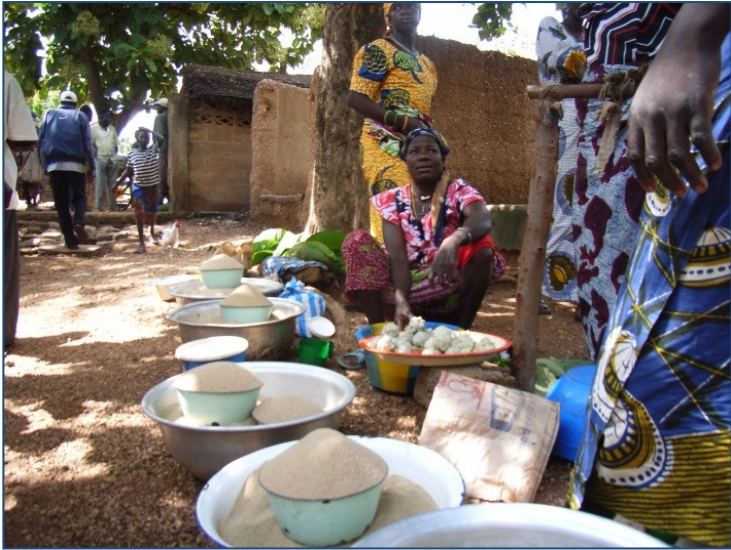
GSO 2004-2006; Economisch project: verwerking van lokaal graan en verkoop