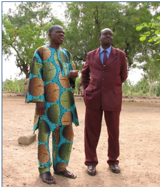
Burgemeester Boukombé en directeur middelbare school Baobab, 2006