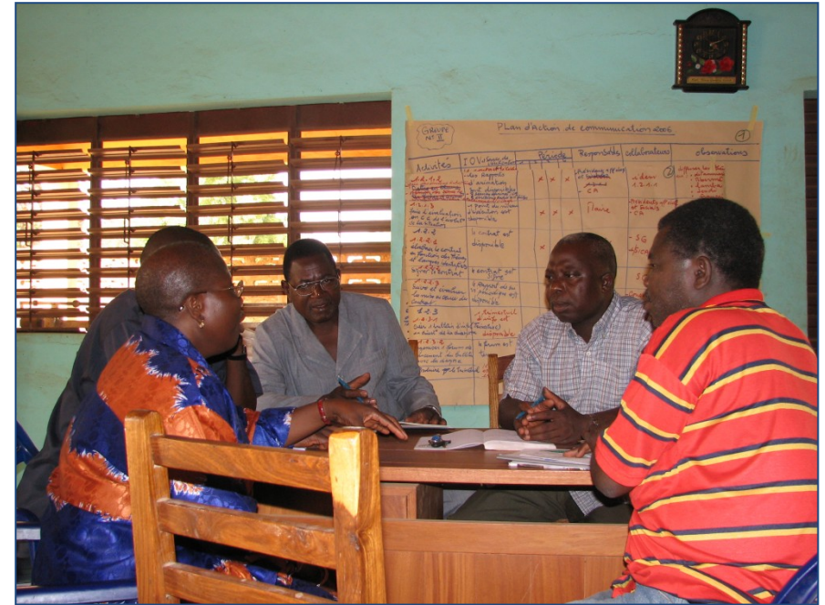
Jaarlijkse planningsessie met steun van SNV-medewerker