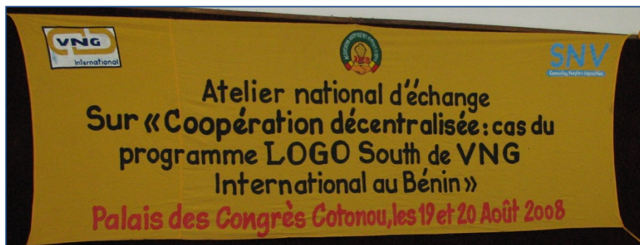
Presentatie van de resultaten van het LOGO-programma in Cotonou, 2008 met alle partners erbij