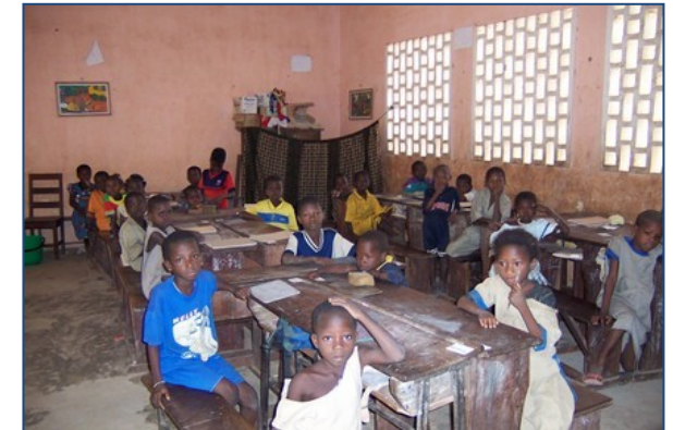
Uitwisseling tekeningen tussen lagere school Boukombé en Varsseveld