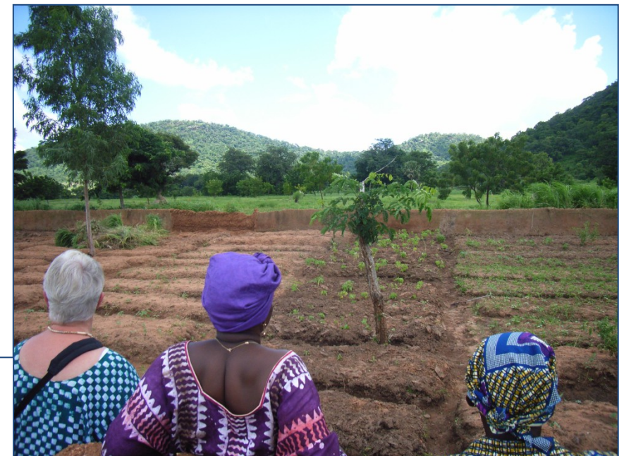
Vrouwenproject Tikona, gemeenschappelijke groentetuin, ommuurd tegen de geiten

Benin programma Gemeente Oude IJsselstreek.