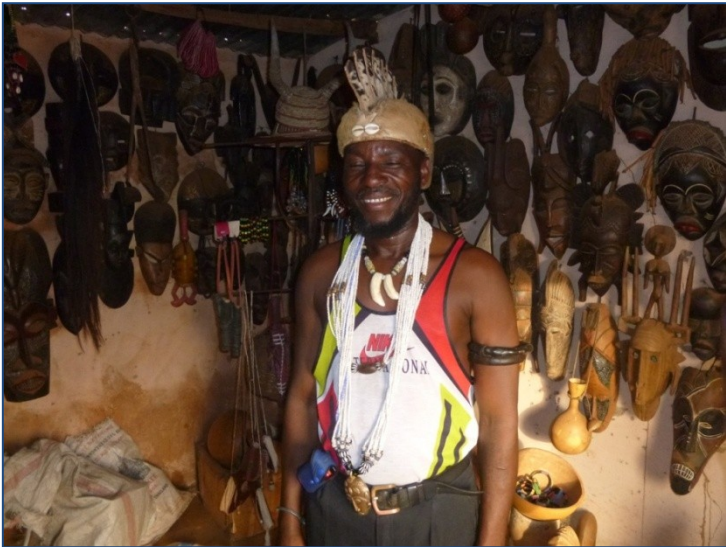
Winkel met toeristische zaken, opgezet met steun van het economisch fonds