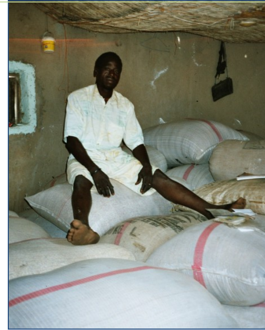
GSO 2004-2006: Een economisch project: opslag van voedsel-gewassen