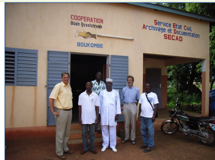
LOGO; Het opgeknapte gebouw van de burgerlijke stand in 2008