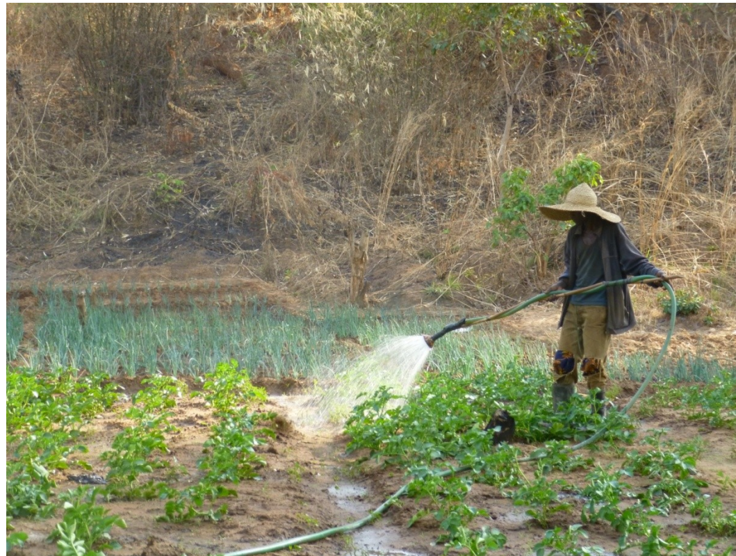
Verlag missie januari 2014 Boukombé en Toucountouna