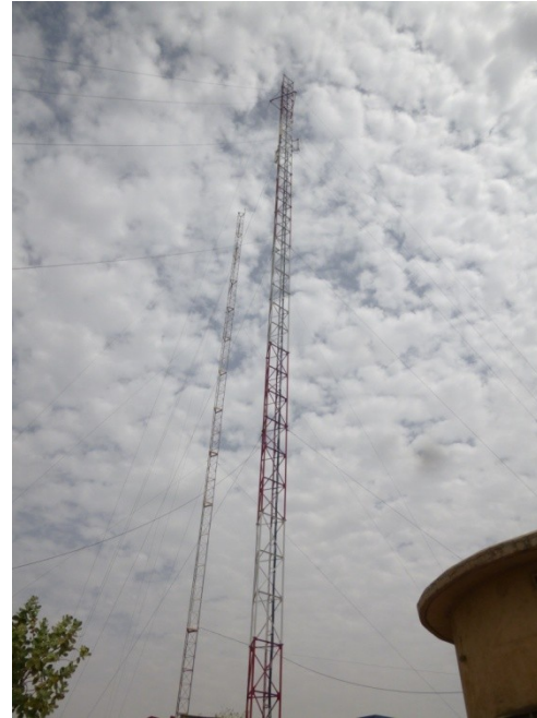
Verlag missie januari 2014 Boukombé en Toucountouna