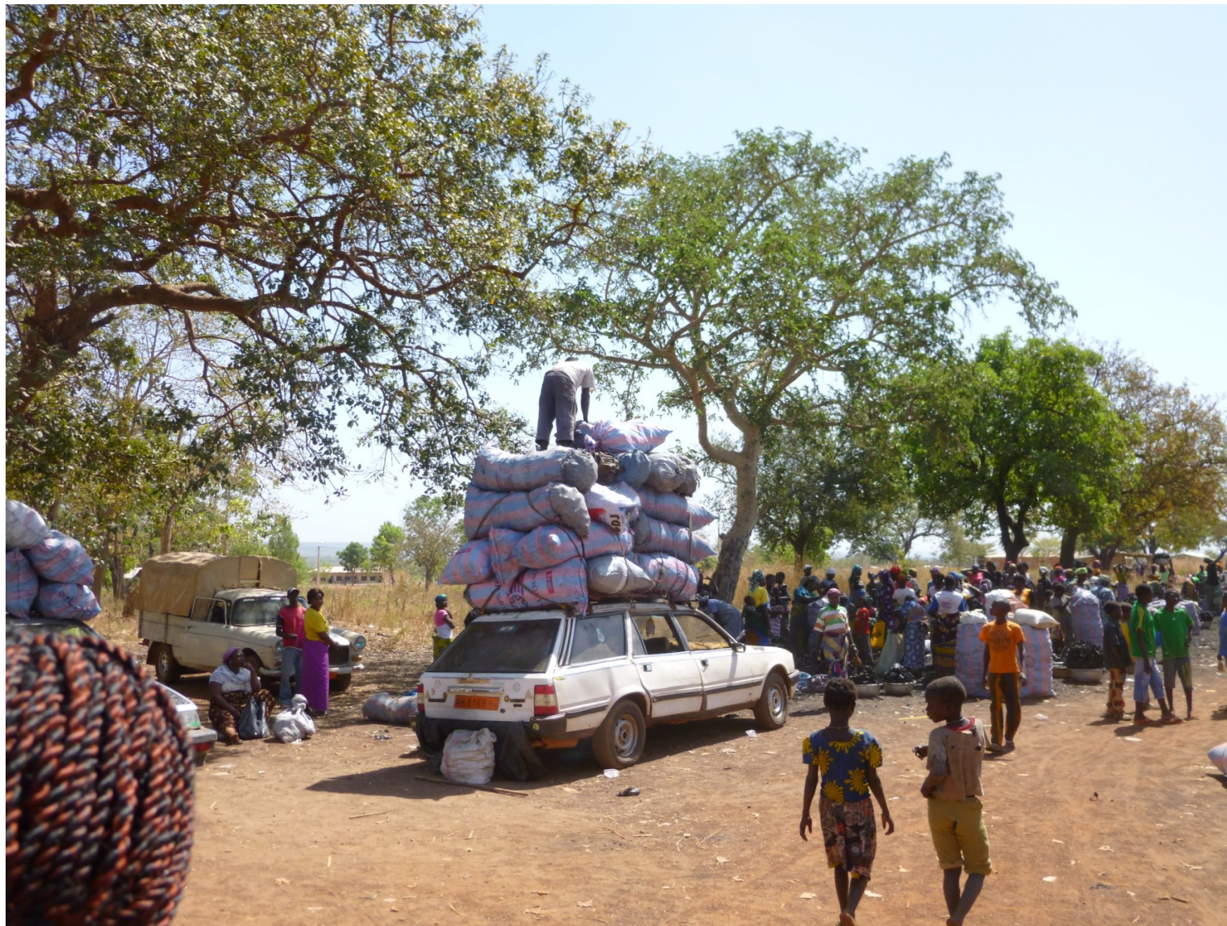
Verslag missie januari 2014 Boukombé en Toucountouna