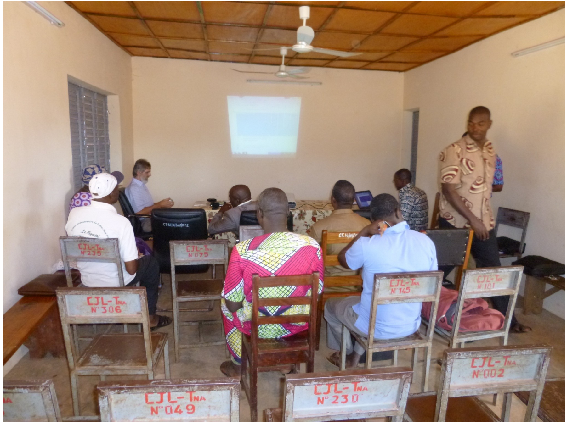
Verlag missie januari 2014 Boukombe en Foucountounda