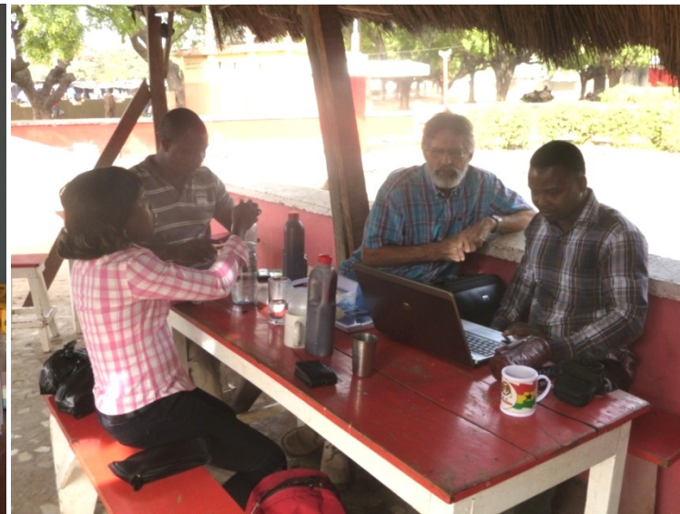
Verlag missie januari 2014 Boukombé en Toucountouna