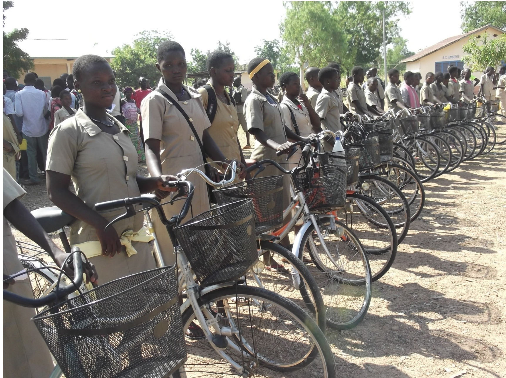
Verlag missie januari 2014 Boukombé en Toucountouna