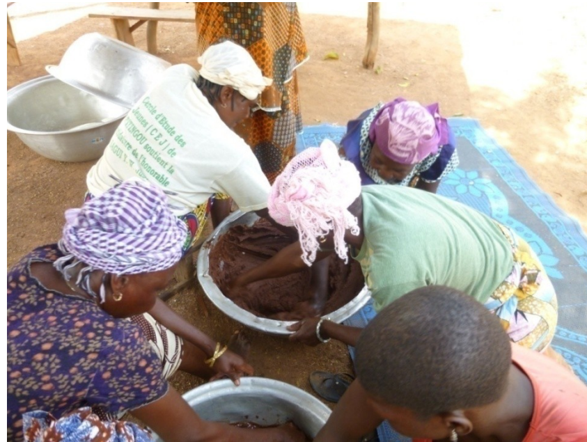
Verlag missie januari 2014 Boukombé en Toucountouna