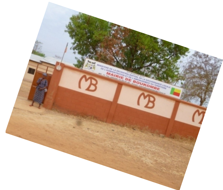
Verslag missie januari 2014 Boukombé en Toucountouna