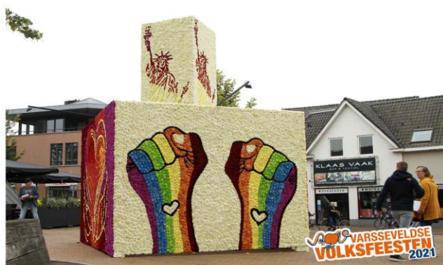
Aangepaste kermisactiviteiten in Coronatijd