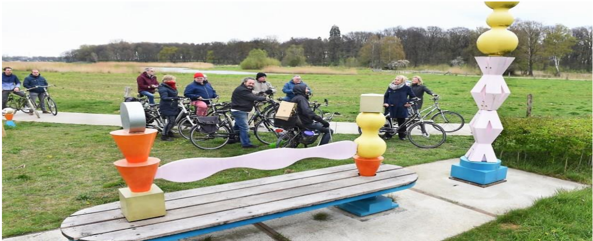
Kleurrijke kunst langs de Oude IJssel

We mogen terecht trots zijn op hetgeen er afgelopen jaren al is gerealiseerd in Oude IJsselstreek.