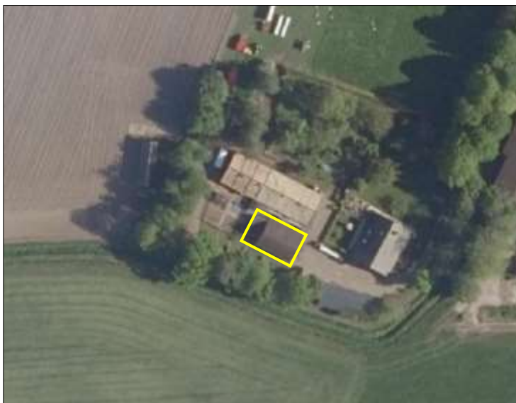
Begrenzing van het plangebied; deze wordt met de gele lijn aangeduid.

Het plangebied vormt een deel van een agrarisch woonerf en bestaat volledig uit bebouwing. De bebouwing bestaat uit één schuur met aanbouw van een serre. Deze schuur beschikt over bakstenen buitengevels zonder luchtsponw en over een dakpannen gedekt zadeldak. De serre is gebouwd tegen de westelijke buitengevel van de schuur en beschikt over een plat dak en glazen buitenwanden. Op onderstaande luchtfoto is de begrenzing van het plangebied aangegeven. Voor een impressie van het plangebied wordt verwezen naar de fotobijlage.