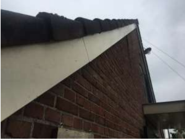
Ruimtes onder gevelpannen en nokpan van de schuur

Door het uitvoeren van de voorgenomen activiteiten wordt geen vleermuis verstoord of gedood en wordt geen vaste rust- of voortplantingsplaats verstoord, beschadigd of vernield.