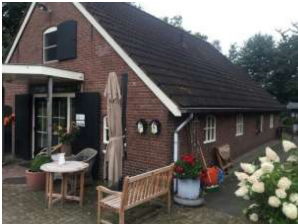
Deze nestkasten kunnen als nestlocatie dienen voor koolmees en pimpelmees

Door het wijzigen van de functie van de schuur wordt geen vogel gedood en geen (bezet) vogelnest beschadigd of vernield. Als gevolg van het uitvoeren van de voorgenomen activiteiten neemt de functie van het plangebied als foerageergebied voor vogels niet af.