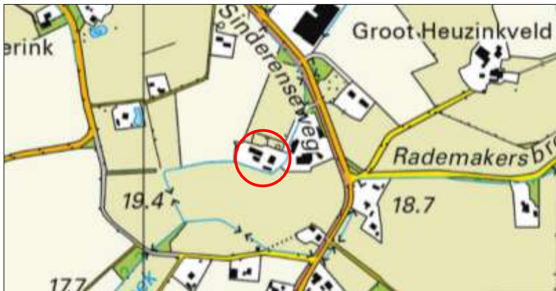
Globale ligging van het plangebied. De ligging van het plangebied wordt met de rode cirkel aangeduid.

Het plangebied is gesitueerd aan de Sinderenseweg 52 te Varsseveld, gemeente Oude IJsselstreek. Het ligt circa 1 kilometer ten zuiden van de woonkern van Varsseveld en wordt omgeven door landelijk gebied. Op onderstaande afbeelding wordt de globale ligging van het plangebied weergegeven op een topografische kaart.