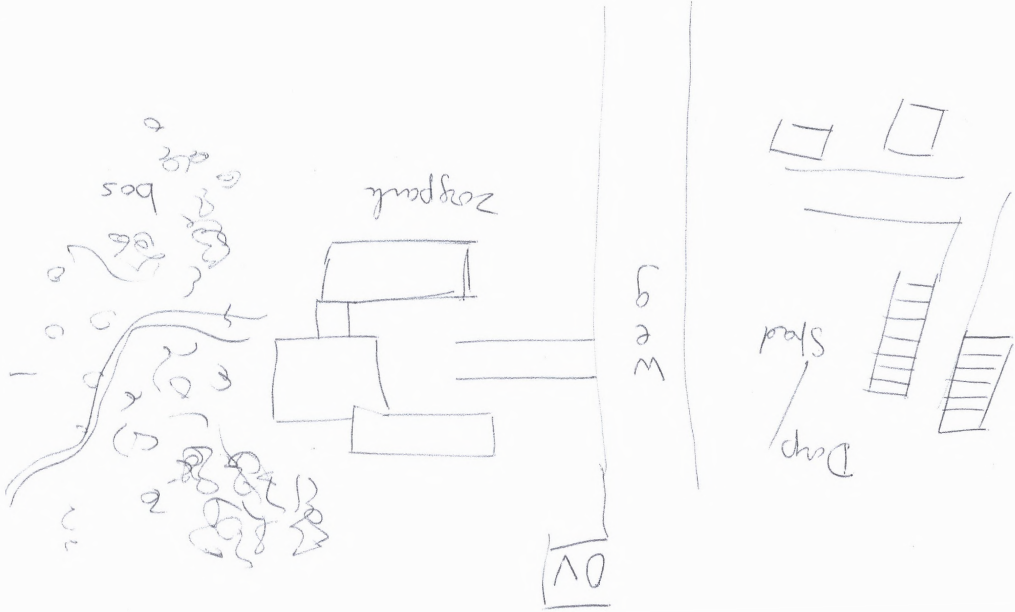
Bijlage 2. Situatieschets van Zogpark met klimaatbeleid