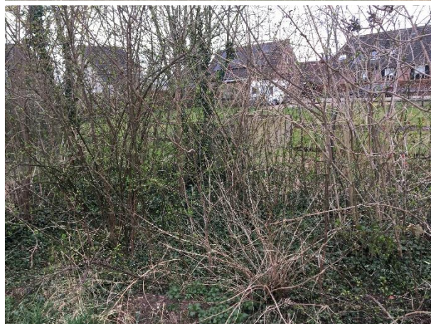
Impressie van het plangebied.