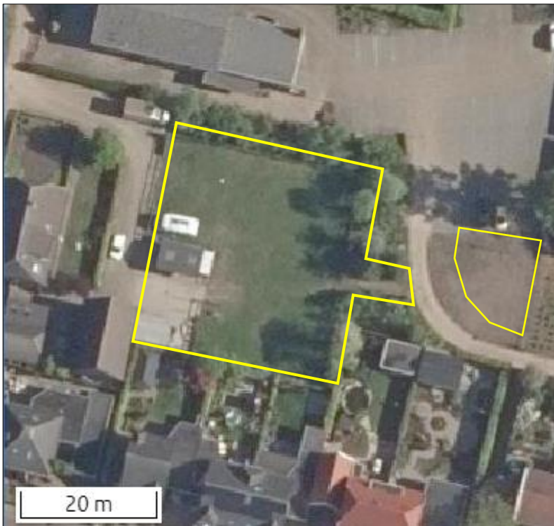
Begrenzing van het plangebied wordt met de gele lijn aangeduid.