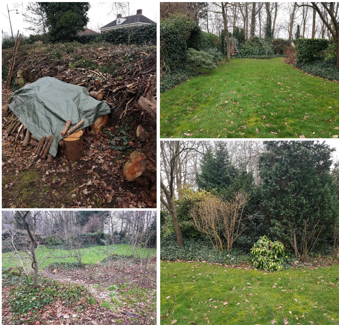
Figuur 2. Een van de takkenhopen (linksboven), gras en perkjes met klimop (rechtsboven), perkjes met kleine bomen (linksonder) en perkjes met coniferen en kleine struiken (rechtsonder).

De tuingrond in het projectgebied bestaat uit gras, perkjes met tuinplanten en struiken, twee forse takkenhopen en diverse kleine, middelgrote en grote bomen. Zie figuur 2 voor een sfeerimpressie van het projectgebied.