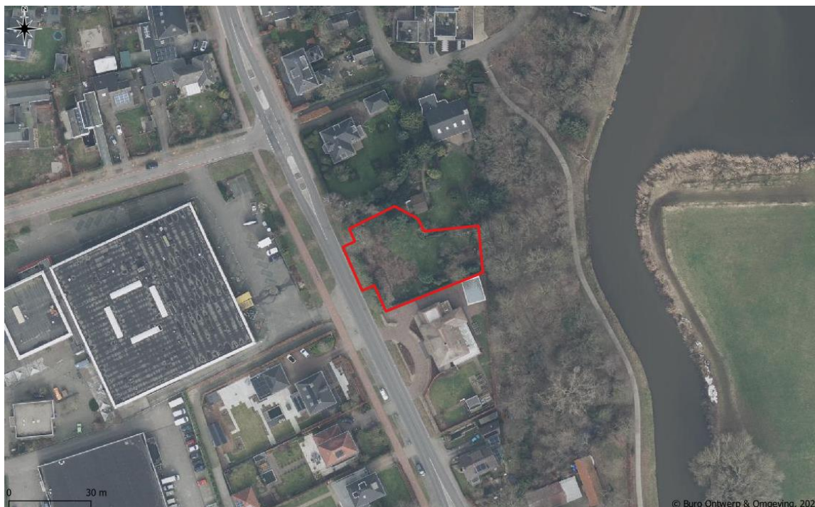
Figuur 1. Luchtfoto van het projectgebied (rood kader).

Het projectgebied bestaat uit de tuingrond behorende tot de Ph. P. Cappettilaan 19 te Ulft. De omgeving van het projectgebied bestaat uit een woonmilieu, enkele bedrijven, houtopstanden en diverse weilanden. Op ca. 40 meter ten oosten van het projectgebied stroomt de Oude IJssel. Op de navolgende afbeelding is de begrenzing van het projectgebied weergegeven.