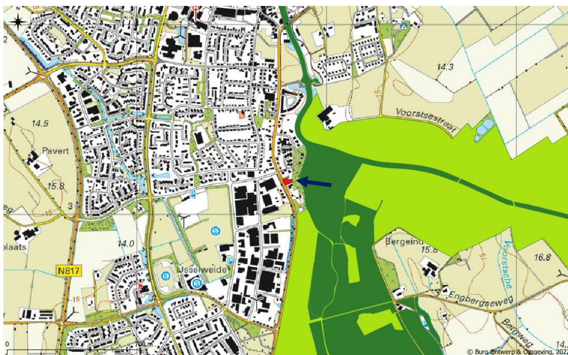
Figuur 4. Ligging projectgebied (rood vlak, met een pijl aangeduid) t.o.v. het Gelders Natuurnetwerk (donkergroen) en de Groene Ontwikkelingszone (lichtgroen).

Het projectgebied ligt op circa 40 meter ten westen van het Gelders Natuurnetwerk (GNN) en op circa 160 meter van de Groene Ontwikkelingszone (GO) (figuur 4). Gezien de ligging buiten deze gebieden worden de kernkwaliteiten en ontwikkelingsdoelen van het GNN en de GO bij de werkzaamheden niet aangetast.