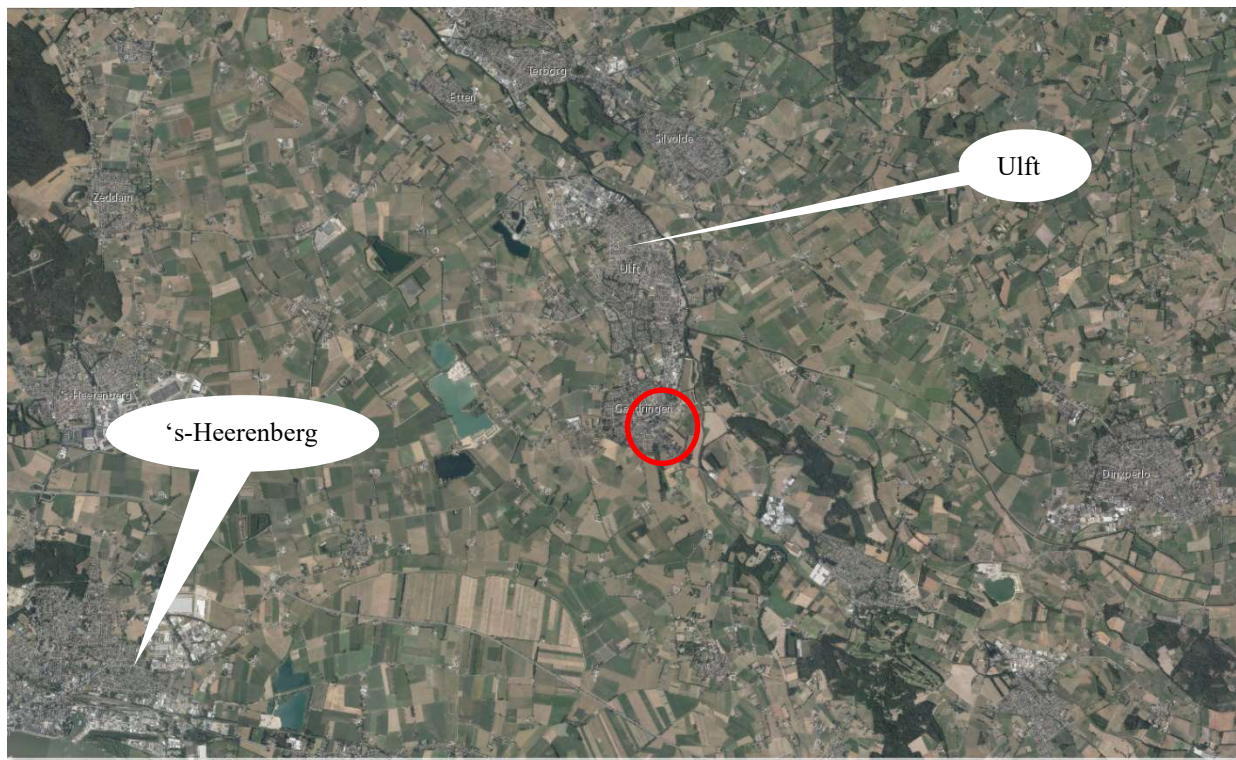
Figuur 3: Ligging planlocatie in de regio (binnen rode lijn)

Figuur 3 en 4 is een luchtfoto met daarop aangegeven het plangebied.