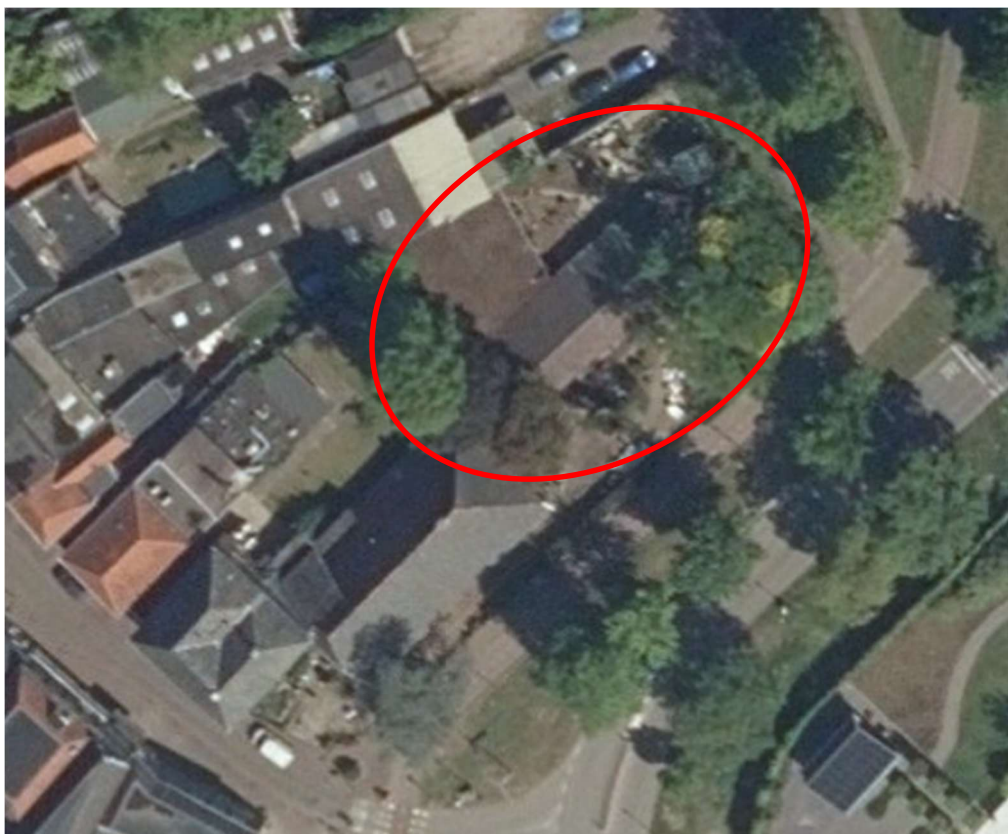
Figuur 4: Ligging planlocatie in detail, (binnen rode lijn)