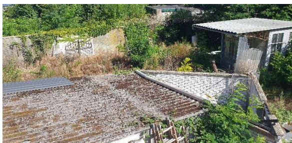
Foto 9: Deel erf