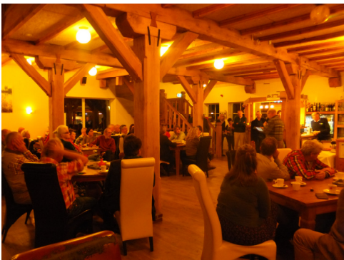
Figuur 1. Openingswoord in 't Lohr

Een kleine 40 inwoners van de gemeente waren naar golfclub 't Lohr in Voorst gekomen. Onder leiding van enkele raadsleden spraken zij in drie groepen over verblijven en toerisme in de Oude IJsselstreek – en daarbuiten. Al snel werd duidelijk dat de aanwezigen zeer trots zijn op hun omgeving. Er is een rijke historie, zowel qua cultuur als natuur, en er is al veel te doen. Er zijn veel, doorgaans kleine, initiatieven die moeite hebben