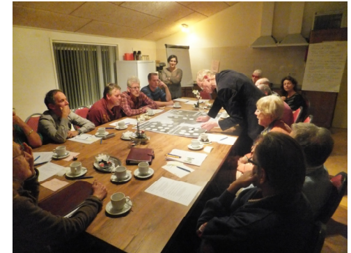
Figuur 2. Overleggen in de groep

Er zijn al fiets-, wandel-, ruiter- en mountainbikepaden maar niet allen zijn ze veilig. Het wordt als een belangrijke taak voor de gemeente gezien om fietsers zoveel mogelijk de kans te bieden wegen waar auto's rijden te vermijden. Daarnaast stoppen veel paden abrupt bij gemeente- en landsgrenzen. Dit is zonde! De samenwerking met andere gemeenten en ons buurland kunnen ook op andere manieren worden benut. Intensievere samenwerking kan leiden tot een grotere aantrekkingskracht van de Achterhoek als grensgebied. Tussen Nederlandse gemeenten moet dan wel meer afstemming komen op het gebied van (besteding van) toeristenbelasting.