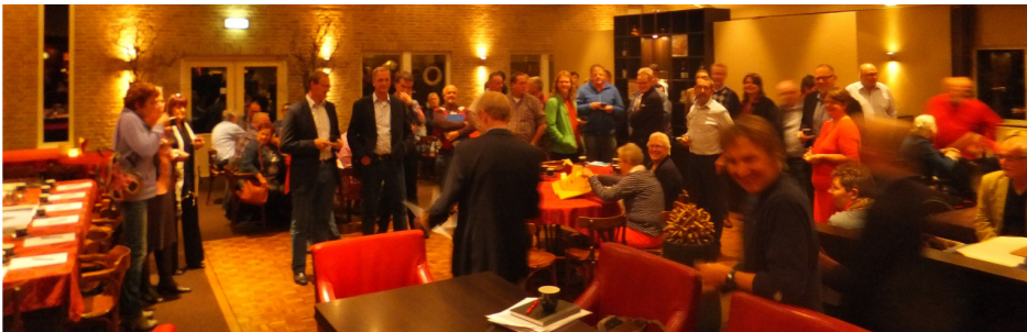
Figuur 1. Voorwoord in partycentrum Terhorst

Bijna 50 inwoners van de gemeente kwamen bij elkaar in partycentrum Terhorst in Netterden om te praten over musiceren, feesten & festivals in de gemeente Oude IJsselstreek. Verdeeld over vijf groepen kwamen veel dezelfde onderwerpen aan bod. De grote lijn in alle gesprekken was de combinatie van centrale coördinatie en samenwerking enerzijds en eigen identiteit behouden en