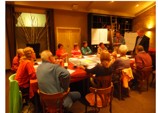
Figuur 2. Groepsoverleg

Om het hoofd te kunnen bieden aan bezuinigingen, vergrijzing en het wegtrekken van jongeren uit de regio, kunnen verenigingen veel meer samenwerken. Dit betekent niet dat ze per se moeten fuseren; samenwerking kan georganiseerd worden zonder de eigen identiteit en het lokale karakter te verliezen. Denk bijvoorbeeld aan kennis delen, elkaar op bestuurlijk niveau ondersteunen, evenementen plannen of materialen en ruimtes delen.